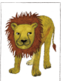
*背景はかかないでね

*上記ルールに当てはまらない場合、採用できない可能性がありますので、くれぐれもご注意ください