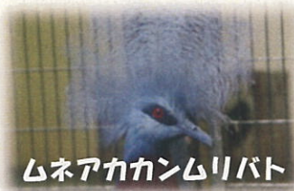
ムネアカカムリバト